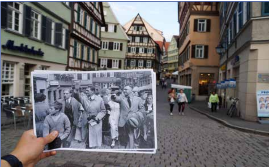
Der Stellvertreter Adolf Hitlers Rudolf Heß auf dem Tübinger Marktplatz.