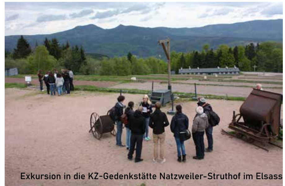
Exkursion in die KZ-Gedenkstätte Natzweiler-Struthof im Elsass